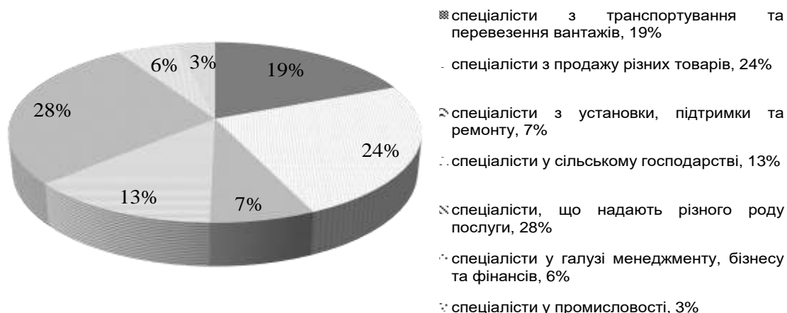
Рис. 1. Галузева структура вакансій, що найбільш схильні до автоматизації, в Україні

Відтак, стає зрозумілим, що в Україні під впливом Індустрії 4.0 може зникнути найбільше вакансій у сфері продажів (24%), потім у сфері транспортування (19%) і сільського господарства (13%).