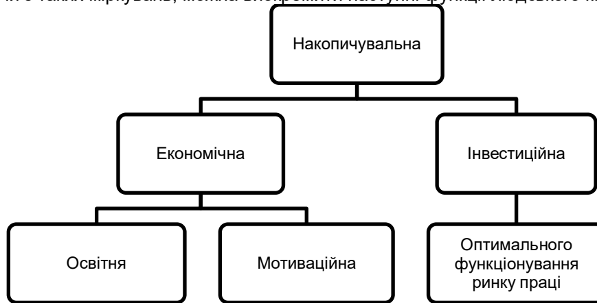
Рис. 1. Функції людського капіталу

Виходячи з таких міркувань, можна виокремити наступні функції людського капіталу (рис. 1).