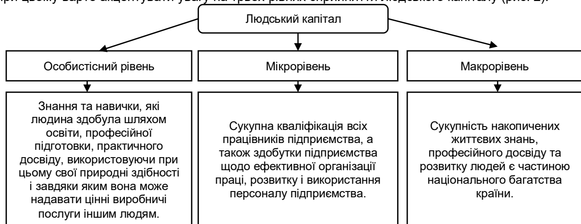
Рис. 2. Рівні сприйняття людського капіталу

При цьому варто акцентувати увагу на трьох рівнях сприйняття людського капіталу (рис. 2).