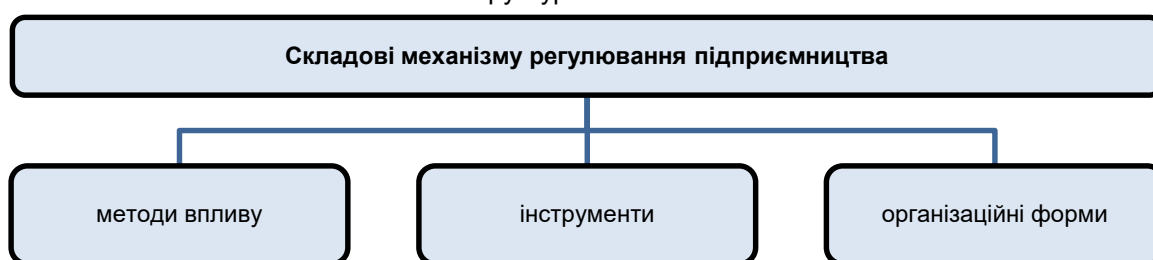
Рис. 2. Основні складові механізму державного регулювання підприємництва

Структурно механізм державного регулювання підприємництва включає взаємопов’язані складові, серед яких ключове місце займають методи впливу, інструментарій їх реалізації та організаційні форми забезпечення регуляторної діяльності (рис. 2). Саме взаємодія цих елементів визначає ефективність державної політики у сфері підтримки підприємництва та її здатність реагувати на виклики економічної невизначеності та структурних змін.