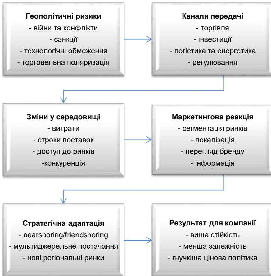
Рис. 1. Концептуальна модель впливу геополітичних ризиків на міжнародне маркетингове середовище

Концептуальна модель впливу геополітичних ризиків на міжнародне маркетингове середовище представлена на рис. 1.