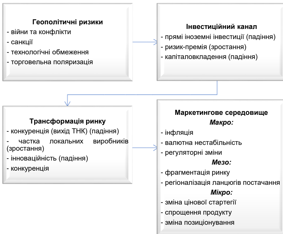
Рис. 4. Концептуальна схема впливу геополітичних ризиків через інвестиційний канал