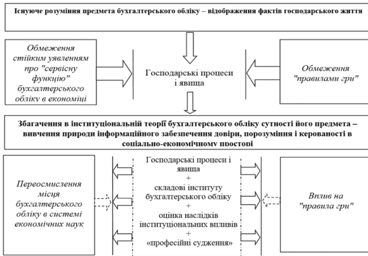
Рис. 3. Інституціональне збагачення предмета бухгалтерського обліку

З огляду на зазначені вище інституціональні орієнтири поглиблення сутності предмета бухгалтерського обліку, можна сформулювати для дискусії його цілісне визначення: предметом бухгалтерського обліку є вивчення природи обліково-інформаційного забезпечення довіри, порозуміння і керованості соціально-економічних просторів. І далі, невід'ємно, – предмет бухгалтерського обліку зосереджується на вивченні його інституціональної сутності і спроможності задоволення зовнішніх інституціональних запитів на облікову інформацію за допомогою професійної інтерпретації фактів і явищ життєдіяльності суб'єктів господарювання (рис. 3).