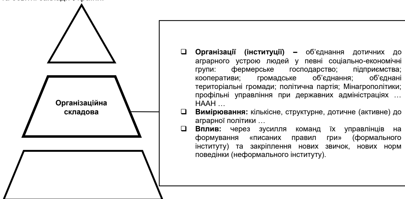
Рис. 2. Організаційна складова інституту аграрного устрою

«Організації» ми трактуємо, як поєднання людей у певні організаційні структури (рис. 2). Фермерська родина (господарство), підприємство, кооператив, сільські ради, заклади соціальної сфери та інші організації в селі або сільській громаді. До організацій в аграрному інституціональному середовищі відносяться і політичні партії з відповідною ідеологією, громадські об'єднання виробників та громад, об'єднання за професійними ознаками, профільні управління в районах та обласних державних адміністраціях, Міністерство аграрної політики та продовольства, інші дотичні органи центральної та регіональної влади, галузеві організаційні структури. До складової «організації» в інституті аграрного устрою відноситься і Національна академія аграрних наук, інші дотичні академічні та освітні заклади України.