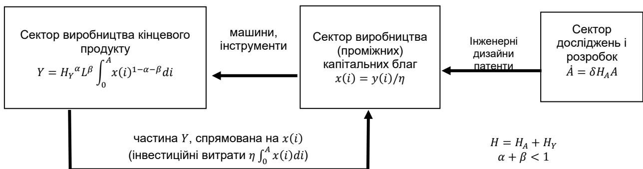
Рис. 1. «Знання-зумовлена» специфікація моделі ендogenous зростання П. Ромера

Верхня межа суми в (4) та інтеграла в (5) дорівнює A (індекс найновішого винайденого блага), а не нескінченності (хоча формально можна записати й інтеграл до \infty , якщо покласти x(i) = 0 для неіснуючих різновидів i > A ). Отже, A – тобто кількість доступних дизайнів (різновидів) – входить у виробничу функцію кінцевого продукту як показник технологічного рівня (продуктивності) через розширення набору проміжних ресурсів.