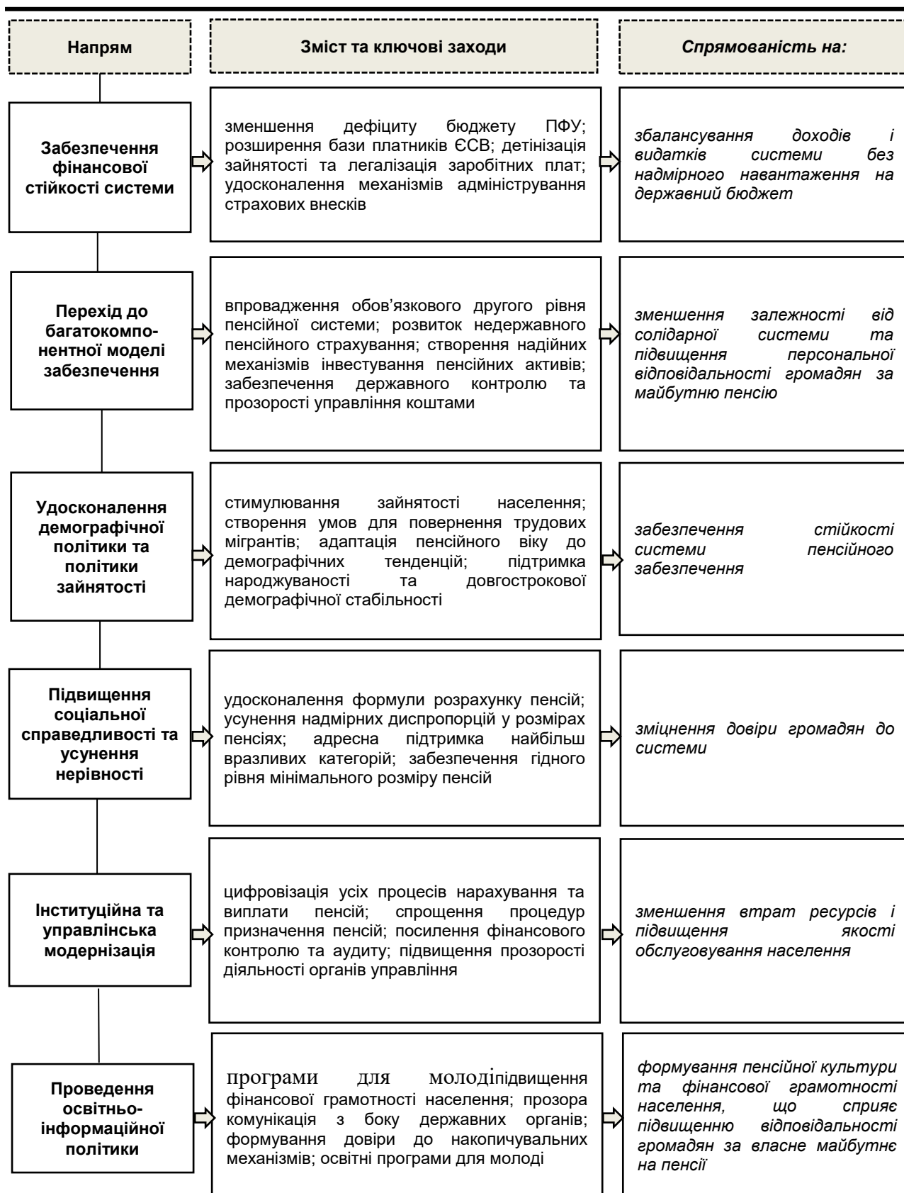
Рис. 2. Напрями вирішення наявних проблем у діючій системі пенсійного забезпечення України