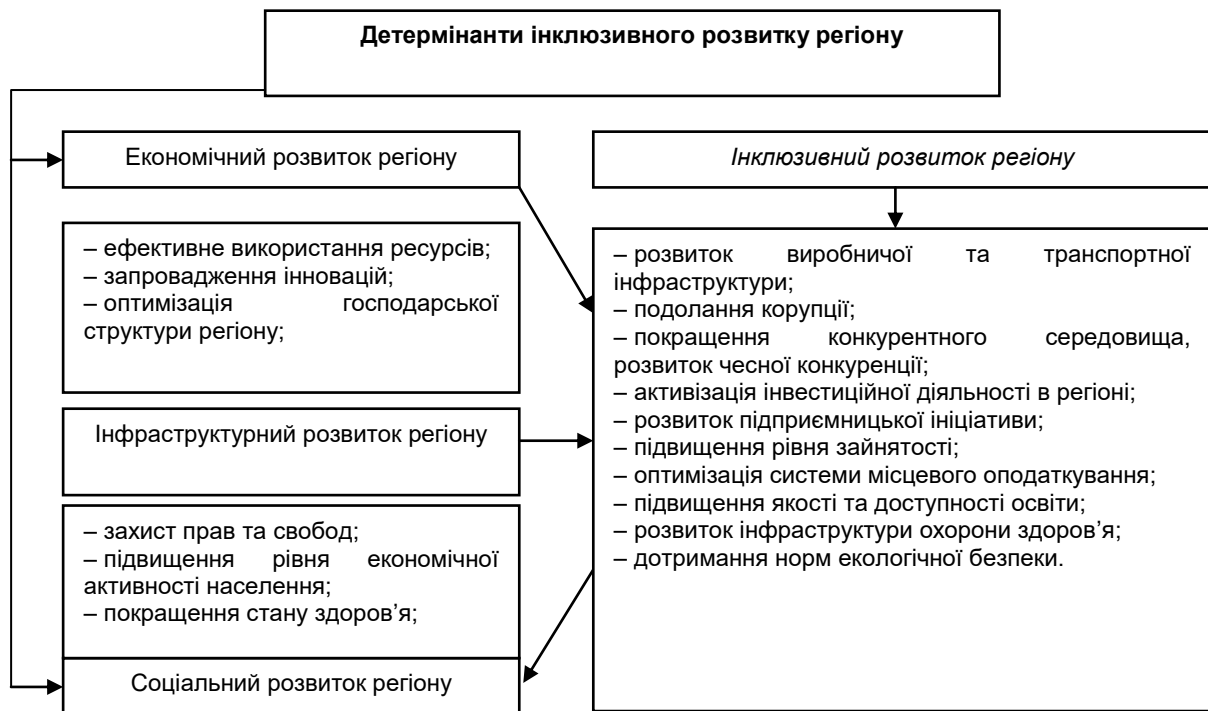
Рис. 4. Детермінанти інклюзивного розвитку регіону