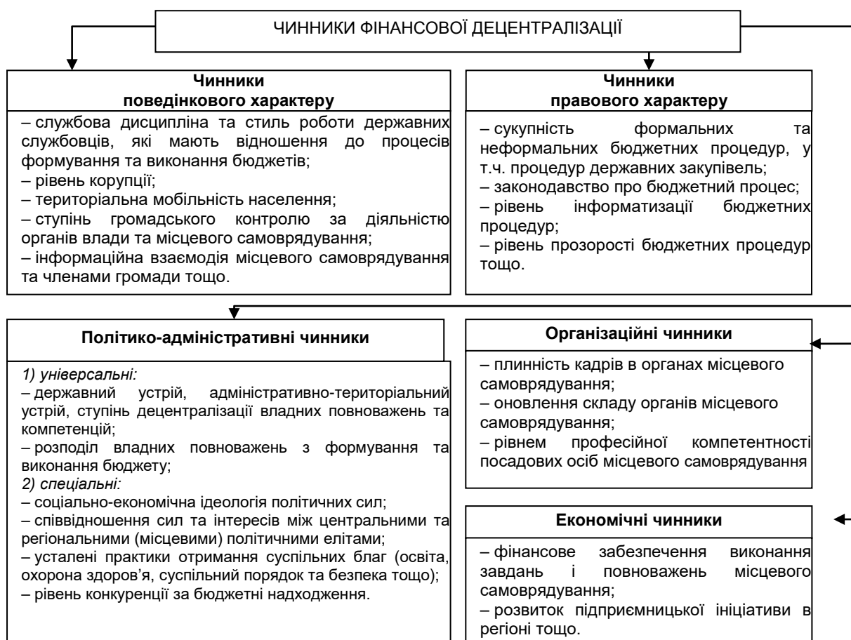
Рис. 2. Основні групи чинників фінансової децентралізації

Під час проведення фінансової децентралізації необхідно враховувати ряд чинників, які обумовлюють процес її впровадження (рис. 2).