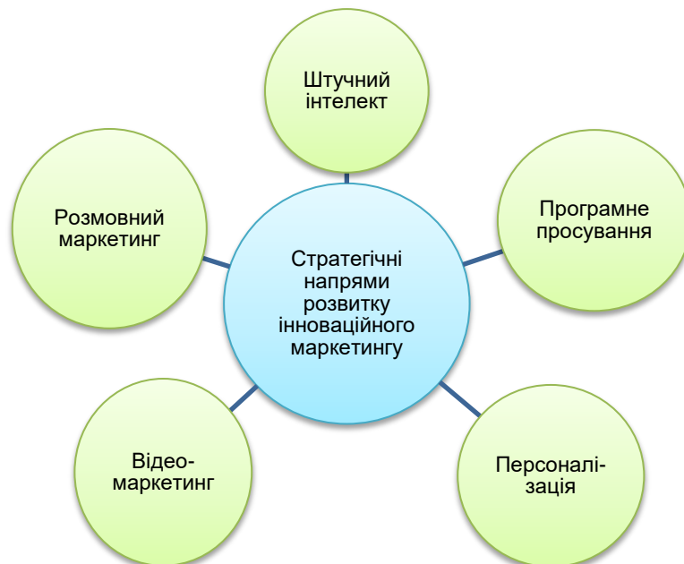
Рис. 1. Стратегічні напрями розвитку інноваційного маркетингу на ринку високих технологій

Зауважимо, що для ефективного розвитку інноваційного товару чи послуги вже недостатньо лише зазначених параметрів. Для реалізації повноцінної інноваційної маркетингової діяльності підприємству важливо постійно проводити моніторинг ринку та нових інструментів, які дозволять вивести продукт на новий рівень. Виділені нами п'ять основних стратегічних напрямів розвитку інноваційного маркетингу на ринку високих технологій наведено на рис. 1. Далі розглянемо їх більш детально.