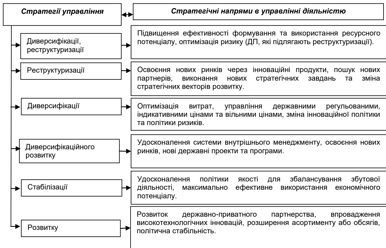
Рис. 3. Стратегії управління в забезпеченні стійкого економічного розвитку державного підприємства