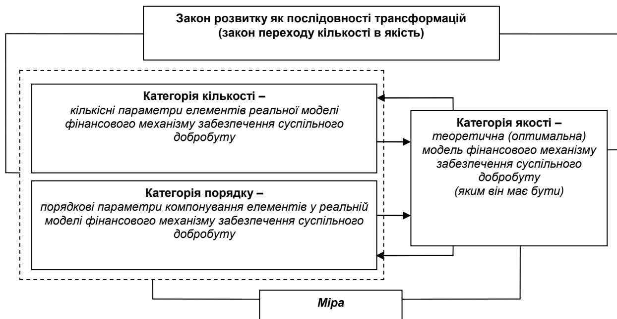
Рис. 2. Взаємозв'язок між категоріями кількості, порядку та якості у трактуванні фінансового механізму забезпечення суспільного добробуту

Нове формулювання діалектичного закону переходу кількісних змін у якісні як послідовності причинно-наслідкової взаємодії якісних, кількісних та порядкових параметрів отримує підтвердження у дослідженні фінансового механізму забезпечення суспільного добробуту. На наш погляд, розкриття його потенціалу та ефективності щодо впливу на рівень суспільного добробуту визначається не лише кількісними змінами параметрів його складових (обсягів фінансування, кредитування, ставок фіскальних платежів, бази оподаткування та ін.), але й структурною композицією їх застосування (поєднання різних методів, форм, важелів, інструментів фінансового механізму у відповідності до існуючих соціально-економічних реалій). Відтак, цілком справедливо, що в основу трансформації теоретичної моделі фінансового механізму забезпечення суспільного добробуту (категорія якості) лягають зміни у реальних параметрах елементів самого механізму (категорія кількості) і підходах до їх комплексного застосування (категорія порядку) (рис. 2).