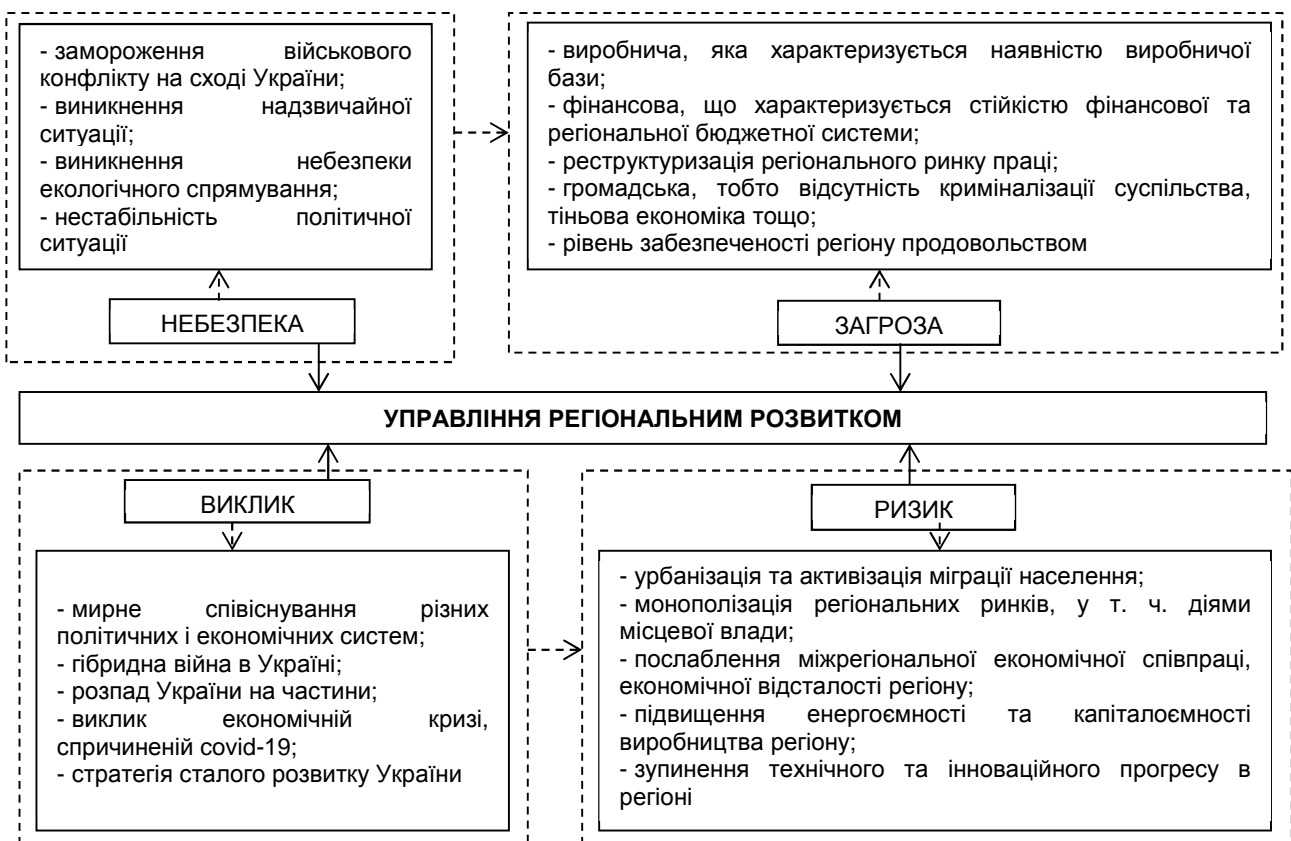
Рис. 1. Система управління регіональним розвитком та чинники впливу на неї

При цьому сукупність викликів може спричинити кризовий стан в регіоні, результатом якого буде гальмування розвитку економічних систем у перспективі, що викликає потребу у відповідному реагуванні з боку системи управління регіональним розвитком й у її складі системи антикризового управління та має на них виключний вплив (рис. 1).