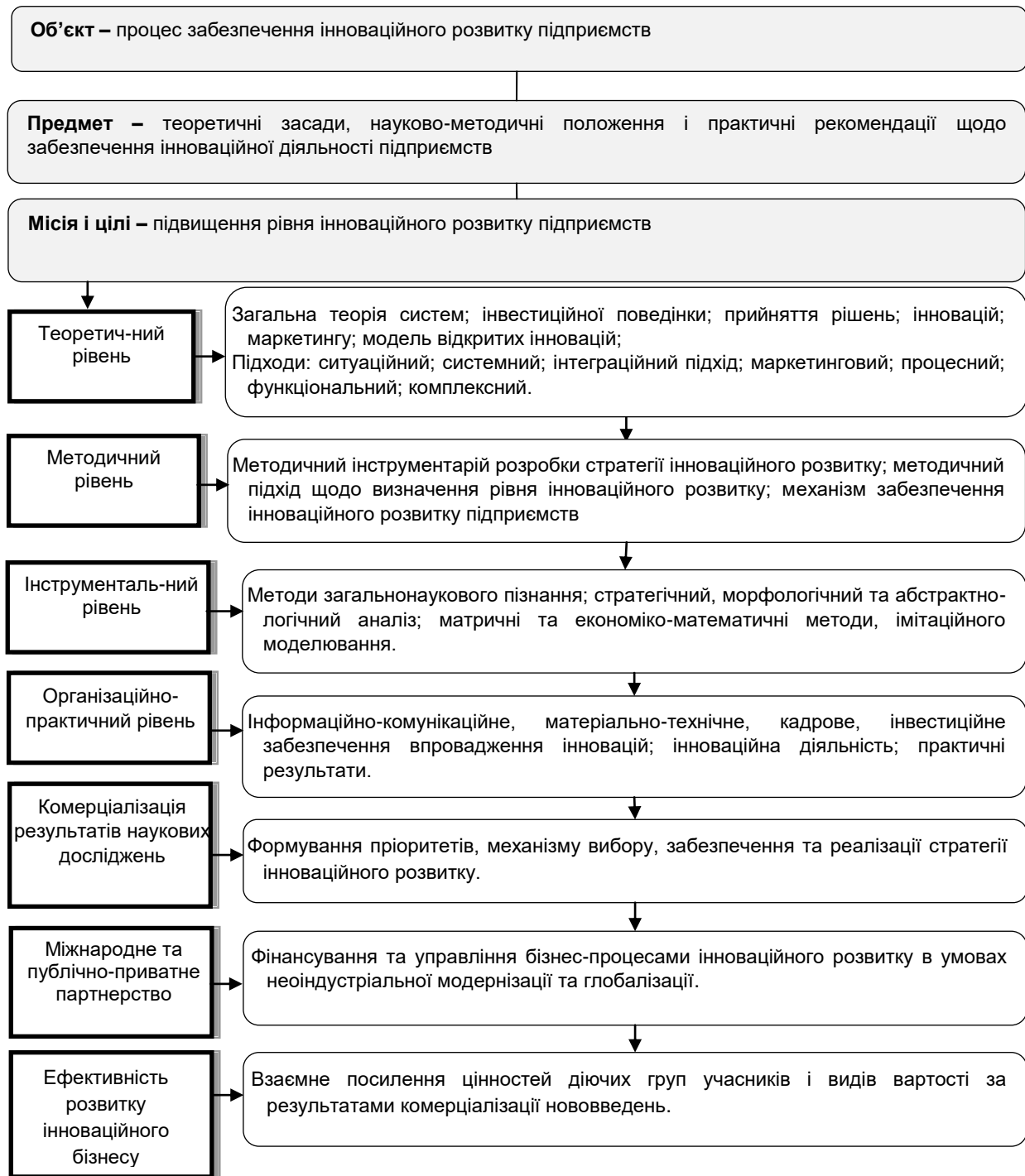
Рис. 2. Концептуальні засади забезпечення інноваційного розвитку підприємств

Інноваційний розвиток підприємств дозволяє організаціям вийти за рамки виробничої стадії відтворювального циклу, надає їм можливість активно брати участь у формуванні інноваційної стратегії, концентрувати зусилля і засоби на відновленні, розробці й освоєнні нової техніки, найбільш повному задоволенні запитів споживачів.