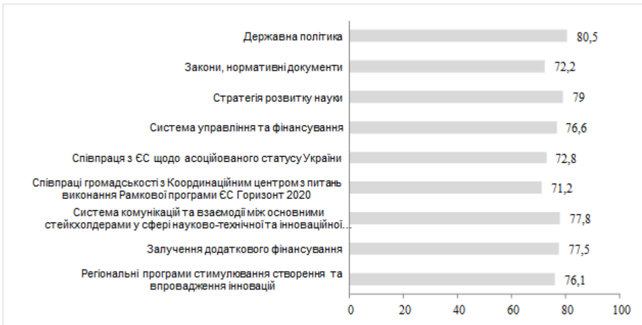
Рис. 3. Фактори розвитку системи взаємодії українських підприємств та наукових організацій і університетів, %