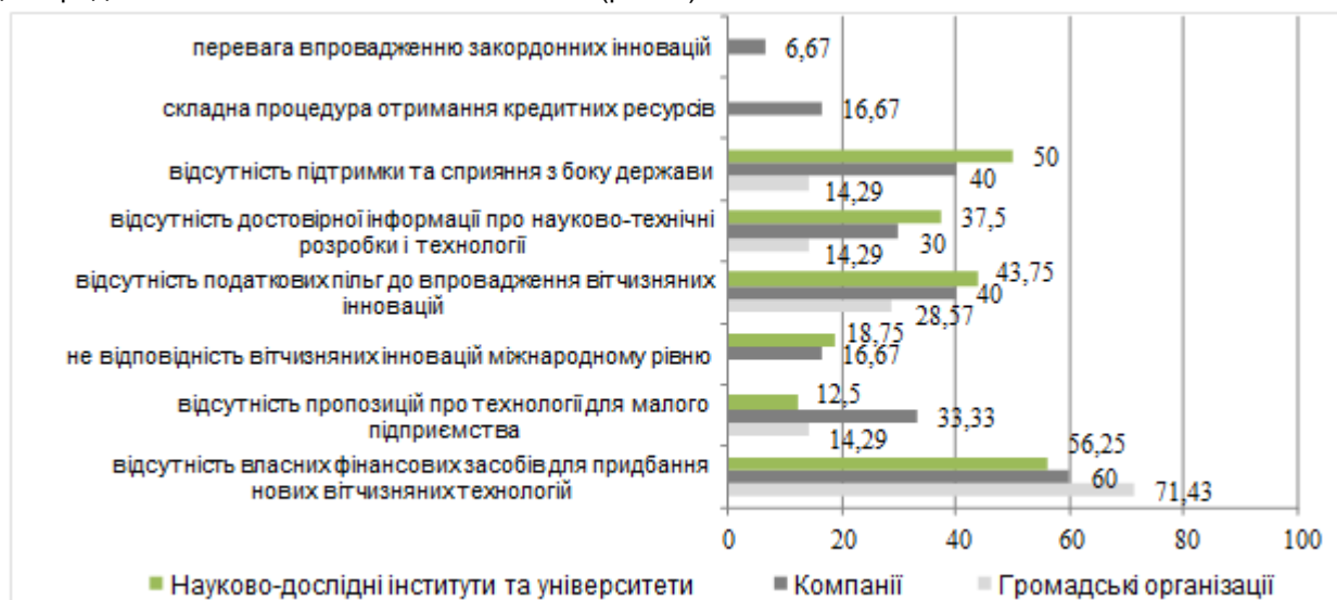
Рис. 2. Бар'єри щодо впровадження вітчизняних інновацій, %

До основних бар'єрів впровадження вітчизняних інновацій було віднесено: відсутність підтримки із боку держави, відсутність податкових пільг для впровадження вітчизняних інновацій, відсутність достовірної інформації про вітчизняні науково-технічні розробки, недостатність фінансів у підприємств для придбання нових вітчизняних технологій (рис. 2).