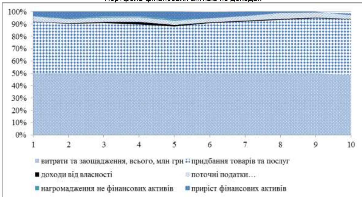
Портфель фінансових активів по витратах