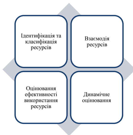
Рис. 1. Комплексний підхід до оцінювання ресурсного потенціалу підприємства

Комплексний підхід до оцінювання ресурсного потенціалу підприємства передбачає системне врахування всіх видів ресурсів (матеріальних, фінансових, людських та інформаційних) та їх взаємодії. Основні етапи такого підходу представлено на рис. 1.