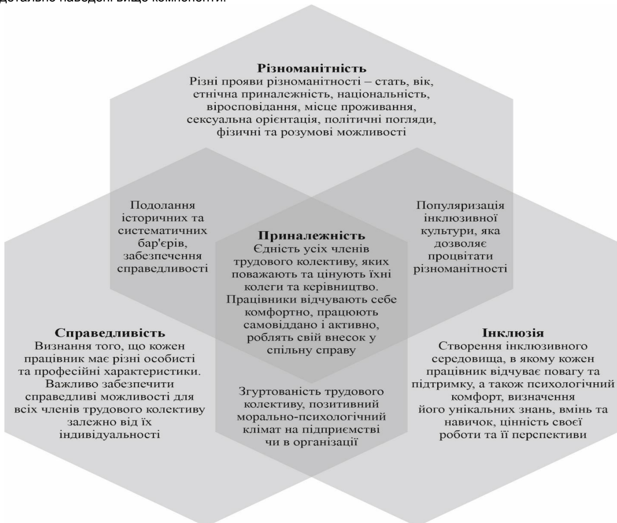
Рис. 1. Принципи рівності, справедливості, інклюзії та приналежності (РСІП) (англ. DEIB ) Джерело: наведено за [28]

Поняття «різноманітність» (англ. diversity ), «справедливість» (англ. equity ), «інклюзивність» (англ. inclusion ) та «приналежність» (англ. belonging ) часто об'єднують разом, оскільки вони взаємопов'язані і лише в їх поєднанні проявляється їхнє справжнє значення (рис. 1). Розглянемо детально наведені вище компоненти.