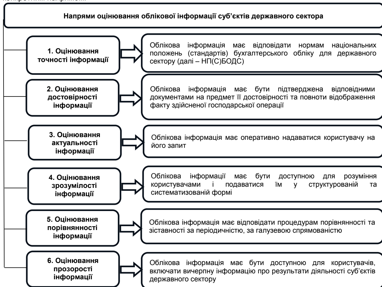
Рис. 1. Напрями оцінювання якості облікової інформації діяльності суб'єктів державного сектора

Основні напрями оцінювання якості облікової інформації ілюструє рис. 1. Кожному напрямку відповідають конкретні завдання з урахуванням характерних ознак інформації, що формується за конкретним напрямом.