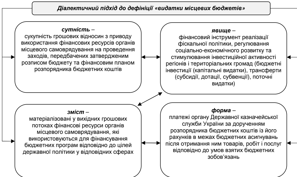
Рис. 2. Трактатування поняття «видатки місцевих бюджетів» (діалектичний підхід)

На основі використання методологічного інструментарію діалектичного підходу до пізнання сутності видатків місцевих бюджетів сформулюємо комплексний науковий підхід до цієї дефініції (рис. 2).