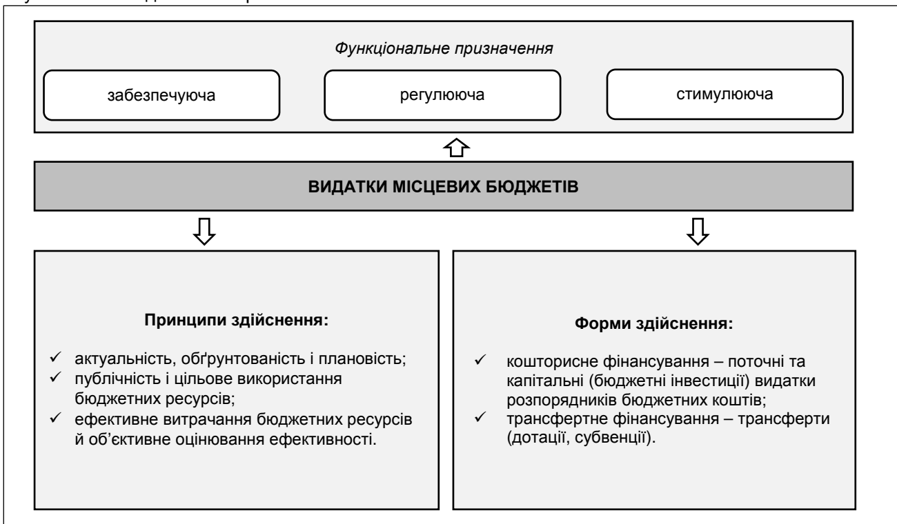
Рис. 4. Принципи, форми здійснення та функціональне призначення видатків місцевих бюджетів

Принципи, форми здійснення та функціональне призначення видатків місцевих бюджетів візуалізовано за допомогою рис. 4.