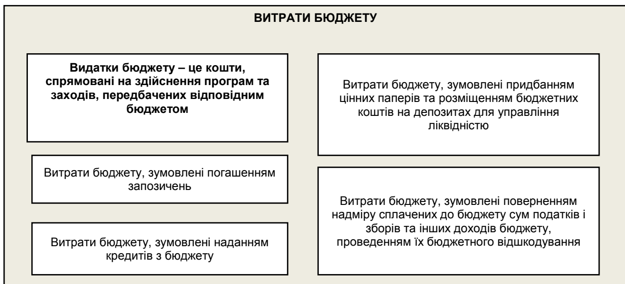
Рис. 1. Дефініція «видатки бюджету» як компонента витрат бюджету у бюджетному законодавстві

Тракування понять «видатки бюджету» та «витрати бюджету» законодавець розмежує у Бюджетному кодексі України (рис. 1).