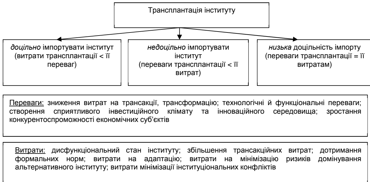
Рис. 2. Алгоритм визначення доцільності трансплантації економічного інституту

При прийнятті рішення щодо імпортування економічного інституту необхідно співставити переваги і вигоди над витратами від процесу впровадження (рис. 2).