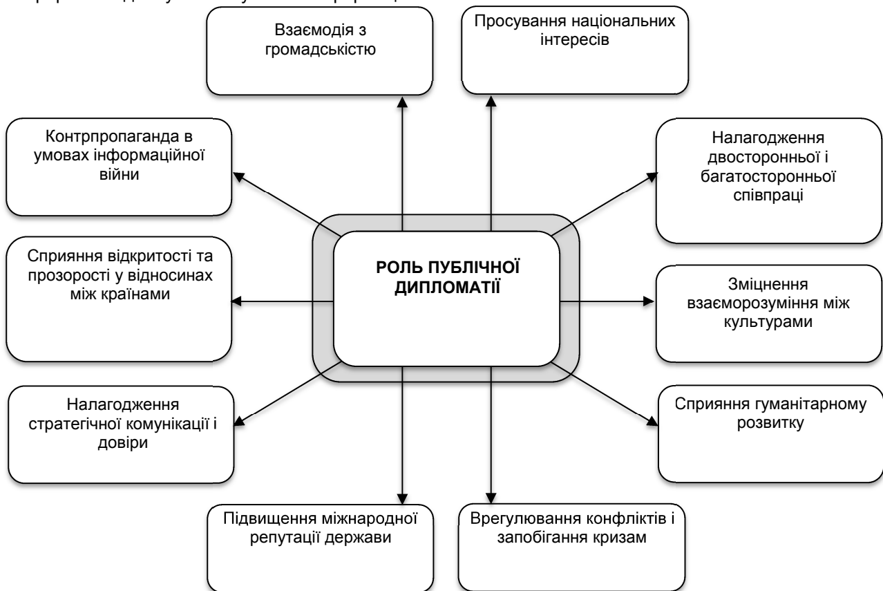
Рис. 1. Сутнісні характеристики та роль публічної дипломатії у системі міжнародних відносин

З огляду на вищезазначене, публічна дипломатія – це складне і багатоаспектне поняття, що базується на ідеї «м'якої сили» як інтегрованої компоненти стратегічної комунікаційної політики держави у системі міжнародних відносин, сутність та роль якого розкривається через важливі характеристики, систематизовані на рис. 1. Публічна дипломатія передбачає активну комунікацію та взаємодію з громадськістю, неурядовими організаціями, медіа та іншими суб'єктами суспільства. Вона є засобом для просування і представництва національних інтересів держави, її цінностей та поглядів на міжнародній арені через комунікаційні канали. Публічна дипломатія може включати як двосторонні відносини між країнами, так і співпрацю в межах міжнародних організацій, а її важливими векторами є взаєморозуміння між культурами, сприяння гуманітарному розвитку, врегулювання міжнародних конфліктів і запобігання кризам. Публічна дипломатія також спрямована на підвищення репутації та міжнародного іміджу держави; налагодження стратегічної комунікації та довіри між країнами. Вона сприяє більшій відкритості та прозорості у відносинах між країнами і, водночас, є інструментом контрпропаганди в умовах сучасних інформаційних війн.