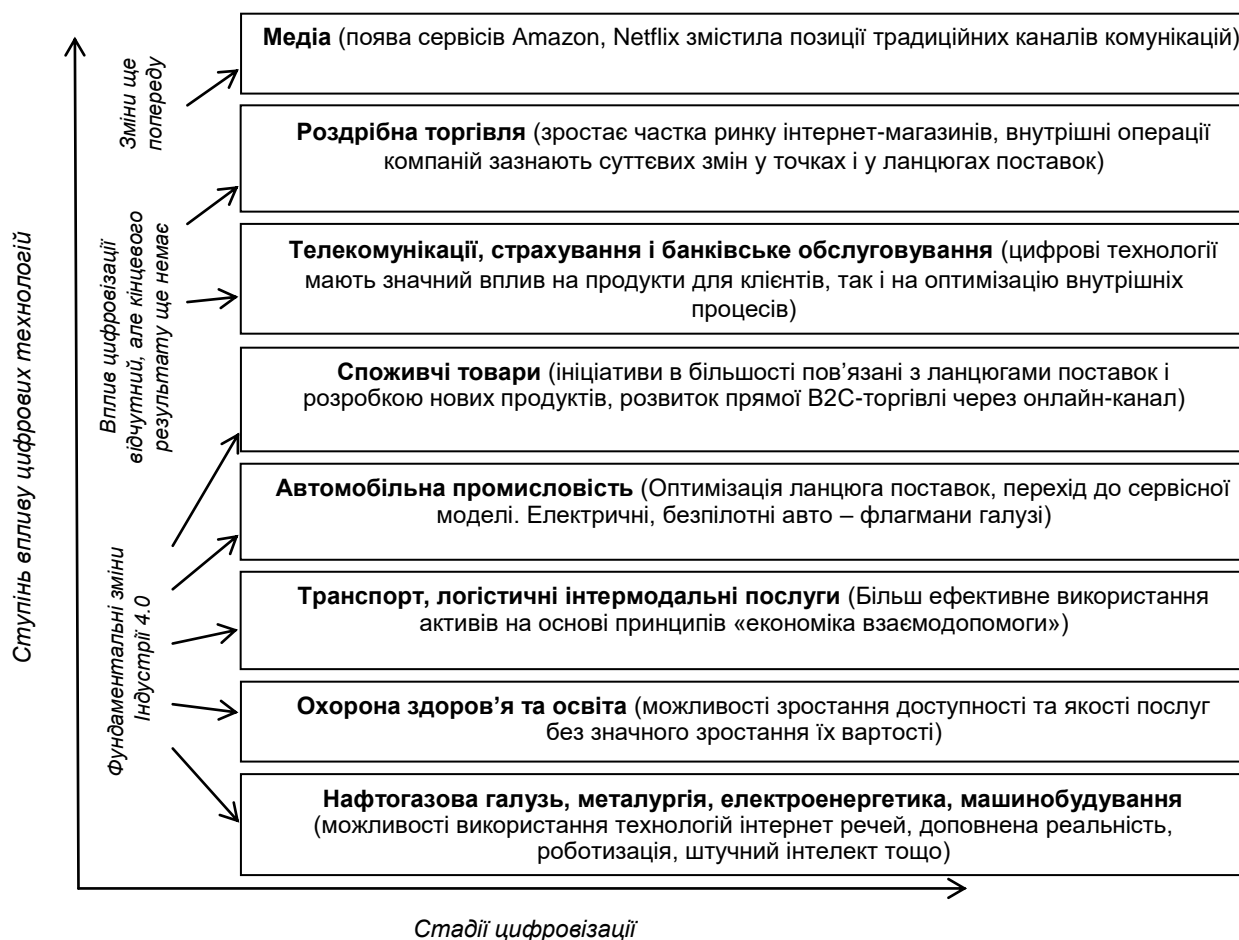
Рис. 1. Оцінка ступеня впливу цифрових технологій на види діяльності

Результати аналізу існуючих видів інновацій стверджують факт необхідності їх розгляду як комплексних змін та унеможлиблює отримання успіху в процесах їх реалізації без розробки механізмів, програм, проектів, а також управління ними. Реалізація інноваційних рішень підприємств можлива за умов виваженого підходу інноваційної політики, яка формує умови залучення до інноваційної діяльності функціональних служб підприємства та формування ефективної логістичної системи забезпечення інноваційної моделі. Нові ринкові потреби розкриваються кваліфікованими маркетинговими дослідженнями, за результатами яких окреслюються завдання у сфері науково-технічних робіт, комерціалізації, логістики і визначають напрями інноваційних змін та ступінь впливу цифрових технологій на види діяльності (рис. 1).