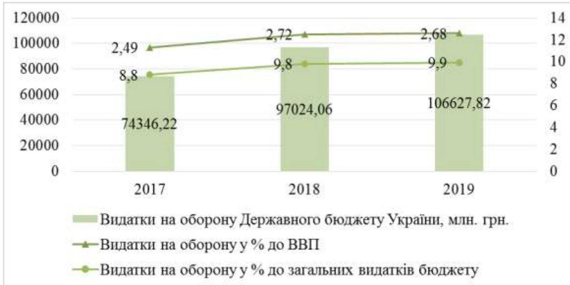
Рис. 1. Динаміка видатків державного бюджету на оборону за період 2017–2019 рр., млн грн

Показники, які відображають динаміку видатків на оборону за період 2017–2019 рр., подано на рис. 1.