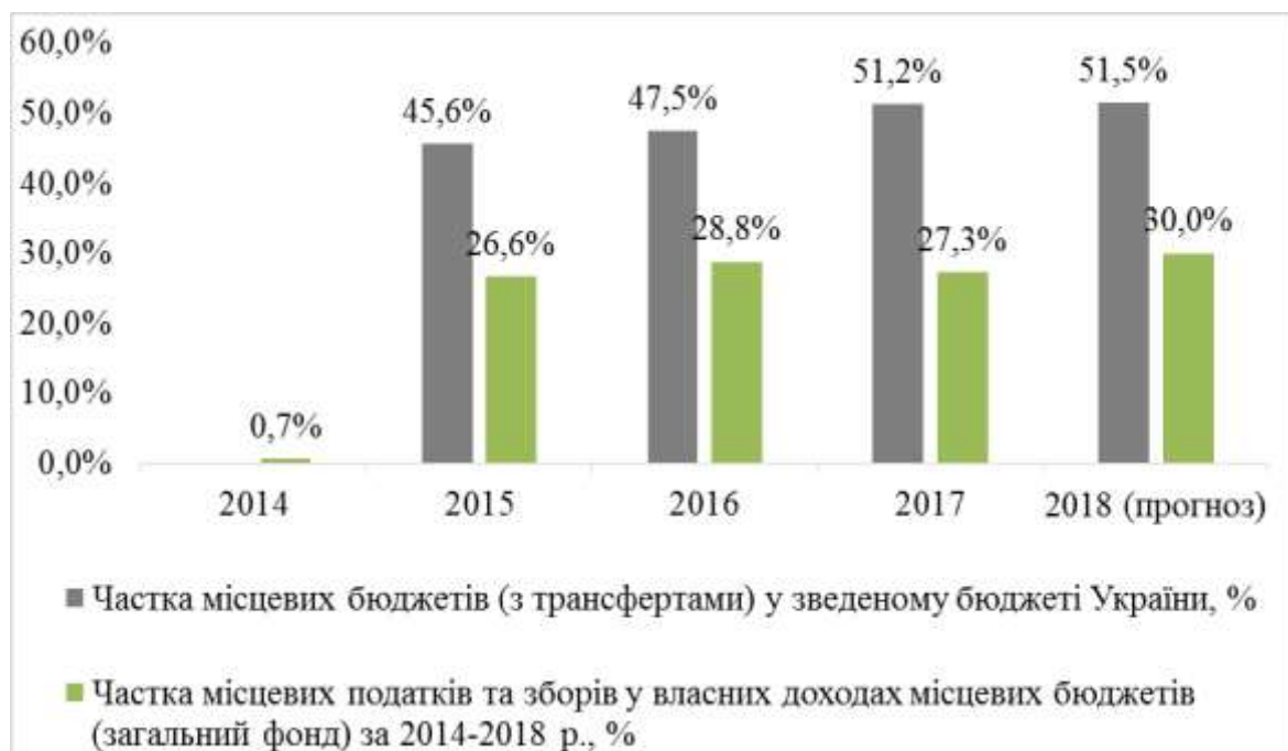
Рис. 3. Динаміка основних показників децентралізації влади в Україні, %

На рис. 3 відображено динаміку основних показників децентралізації влади в Україні.