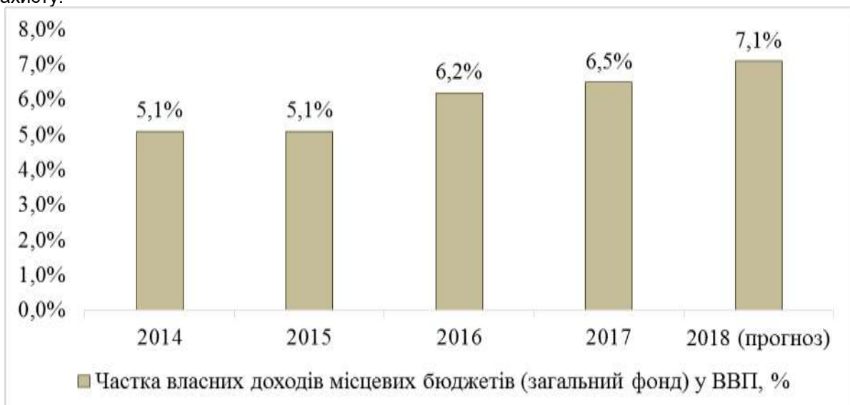
Рис. 2. Динаміка частки власних доходів місцевих бюджетів України (загальний фонд) у ВВП, %

Кошти місцевих бюджетів насамперед спрямовуються на фінансування діяльності обласних, районних, селищних та сільських рад, фінансування розвитку інфраструктури, соціальних проектів у галузях освіти, охорони здоров'я, туризму, дорожньо-транспортної інфраструктури, соціального захисту.