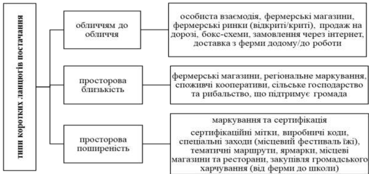
Рис. 1. Типи коротких ланцюгів постачання